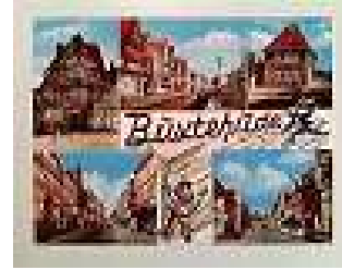
Es war einmal